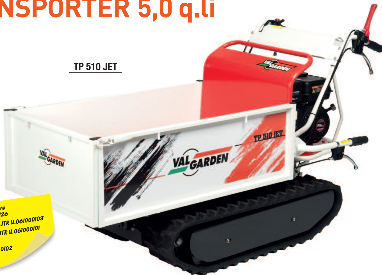
TP 510 JET

Cavo Acceleratore JTR U.061000126 Cavo Direzione JTR U.061000103 Cavo Frizione JTR U.061000101 Cavo Freno JTR U.061000102