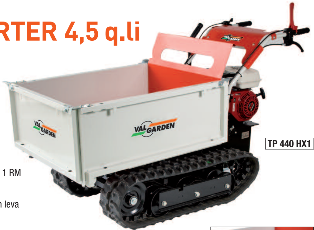
TP 440 HX1

Motore Jet Power 4T OHV J-70 Cilindrata 208 cc - HP 7,0 circa